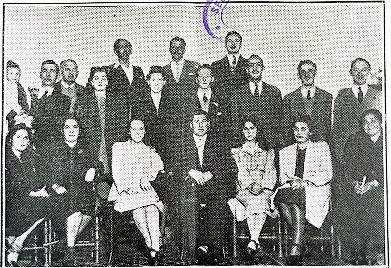
Sociedad de Jóvenes de la Iglesia Bautista Oeste, Rosario