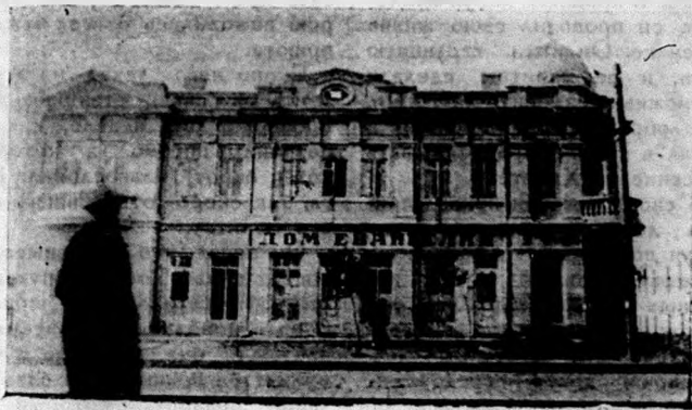
Дом Евангелия в Харбине — центр Еванг. Движ. Русской Молодежи.