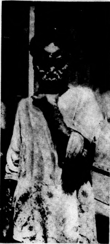
Девушка, покрытая булгурчатой проказой.

Страшная болезнь проказа начинается с самого незначитель-