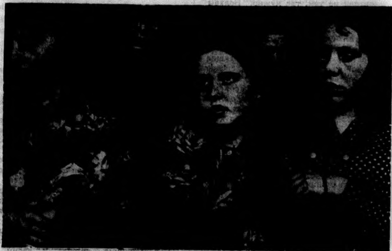
Девушка в экстазе видит видение.

С момента революции в Испании, когда трон был поколеблен и телеграф то и дело приносил вести о погромах монастырей и сожжении многочисленных церквей, у всех создавалось впечатление, что испанцы пошли по следам русских безбожников и совершенно отказались от христианства.